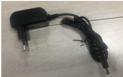
9. Adattatore AC/DC (VDE)