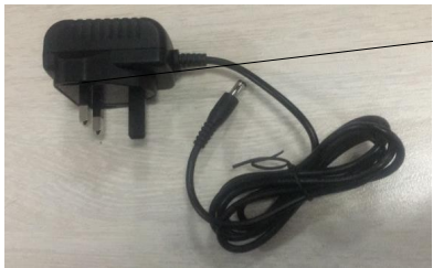
9. Adattatore AC/DC (UK)